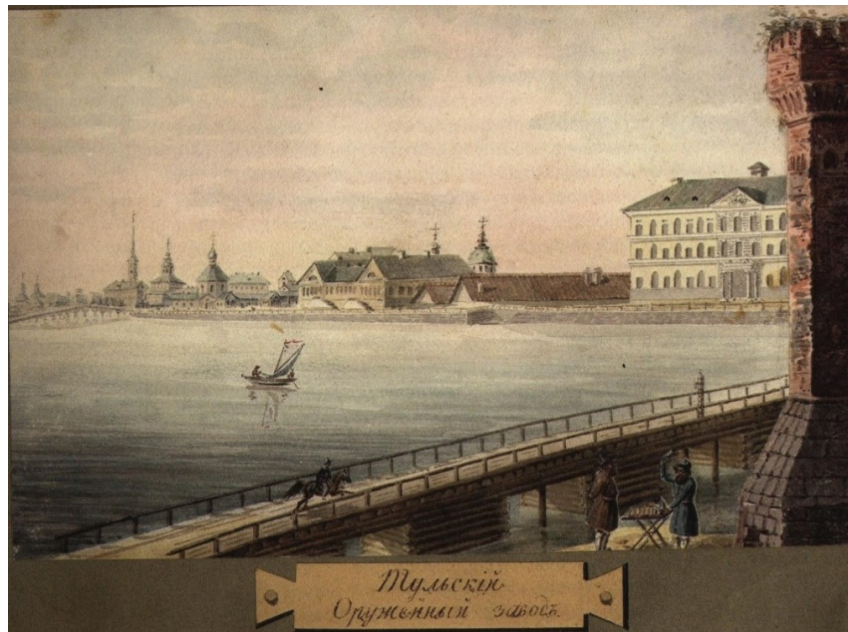
Tula Arms Plant. Unknown artist. Ca. 1820s. Watercolour from the album "Travels of P.P. Svinyin through Russia"

The visit of Catherine II to Tula in 1775 gave impetus to taking measures to improve the lives of gunsmiths.