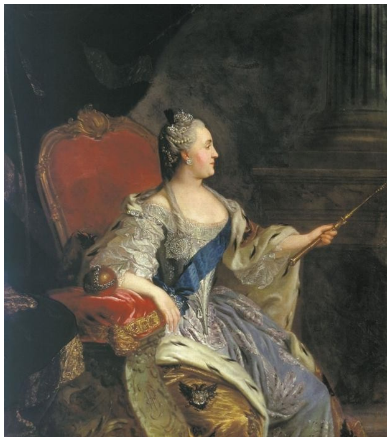
Coronation portrait of Catherine II. A fragment. F. Rokotov

The visit of Catherine II to Tula in 1775 gave impetus to taking measures to improve the lives of gunsmiths.