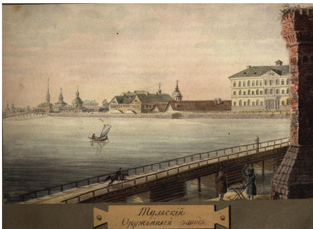
Тульский оружейный завод. Неизвестный художник. Около 1820-х гг. Акварель из альбома «Путешествия по России П.П. Свиньина»

В данном контексте представляется важным уточнить, каким образом идея самоуправления была представлена на Тульском оружейном заводе (далее — ТОЗ) во второй половине XVIII — первой половине XIX в.