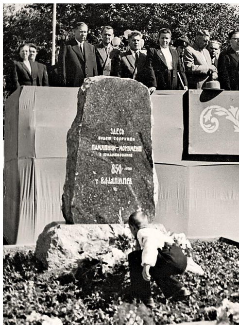
Закладка памятника на площади Свободы

Существенными элементами коммеморативного лоббизма 55 лидеров Владимирской области стали совместные письма К.Н. Гришина и В.Я. Спорова к руководителям партийных и советских структур власти: от 25.06.1957 г., адресованное Н.С. Хрущеву 56 , от 26.08.1957 г., направленное председателю Совмина РСФСР М.А. Яснову 57 . В этих обращениях кратко резюмировались основные просьбы владимирского руководства к центру в связи с юбилеем города 58 .