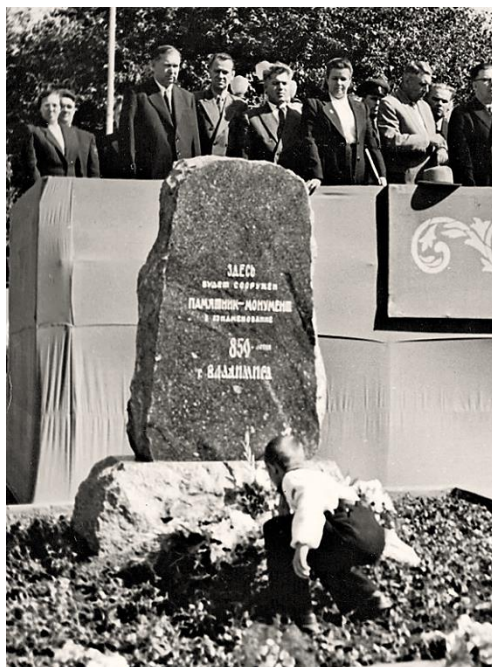
Laying the foundation stone of the monument in Svoboda square