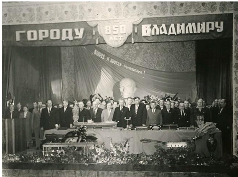
Celebration of the 850 th anniversary of the city of Vladimir in the House of Culture of the Vladimir Chemical Plant