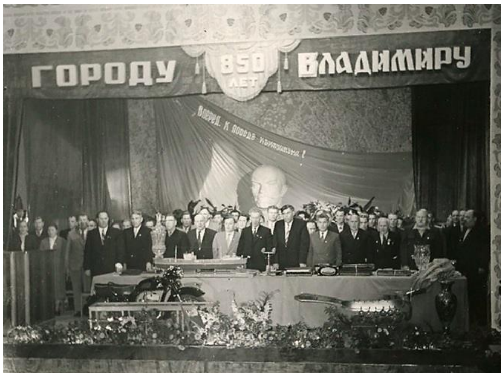
Празднование 850-летия г. Владимира в стенах нового Дворца культуры Владимирского химического завода