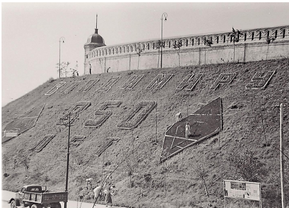
Клумба у гостиницы «Владимир»

Кластер документов исследованного архивного дела открывается копией письма Госплана РСФСР от 17 января 1957 г. № 240-15, адресованного в Совмин РСФСР («т. Яснову М.А. – от Госплановой комиссии Совмина РСФСР»). Регистрация этого письма во Владимирской области с грифом «подлежит возврату в особый сектор обкома КПСС» датируется 8 марта 1957 г. (входящий № 6487-365) 31 . Этот документ дал возможность оценить широкий спектр бюрократических структур и институтов власти, формально участвовавших в поддержке юбилея, но часто неохотно откликавшихся на инициативы регионов. В письме Госплана РСФСР за март 1957 г. фиксируется совместное рассмотрение «с заинтересованными министерствами» проекта Постановления Совета министров СССР «О мерах помощи хозяйству г. Владимира в связи с его 850-летием», которое было внесено Владимирскими обкомом КПСС и облисполкомом.