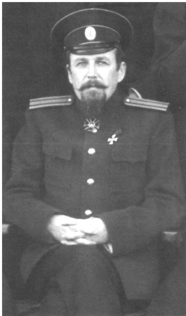
Пилкин Владимир Константинович (контр-адмирал, на фото в погонах капитана первого ранга). Фото сделано предположительно между 1909–1916 гг.

А.В. Карташев с помощью своих единомышленников в Париже (П.Б. Струве и др.) и Сибири (В.Н. Пепеляев и др.) активно поддерживал кандидатуру Н.Н. Юденича на пост главнокомандующего Северо-Западной армией. В письме В.Н. Пепеляеву он писал: «Струве и я создали Юденичу репутацию приемлемого для Парижа и Лондона “генерала”», ориентировавшегося на Антанту и признававшего политическую платформу А.В. Колчака. Самого Юденича Карташев оценивал как «по существу правого», но «благоразумного и умеренного», отмежевавшегося от «крайних правых» 22 . В письмах А.В. Колчаку и В.Н. Пепеляеву он подчеркивал, что «по совести и убеждению всеми средствами содействовал созданию авторитета генерала Юденича» 23 . Карташев призы-