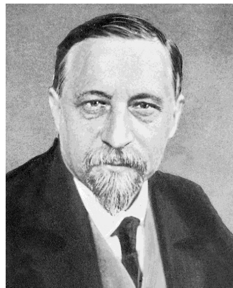
Антон Владимирович Карташев

В ночь с 25 на 26 октября 1917 г. А.В. Карташева арестовали в Зимнем дворце вместе с другими министрами Временного правительства и отправили в Петропавловскую крепость 7 . После освобождения из заключения в конце января 1918 г. он включился в активную борьбу с большевиками. Карташев перебрался в Москву, перешел на нелегальное положение, стал одним из организаторов антисоветского подполья. Весной 1918 г. он в качестве члена ЦК кадетской партии вошел в Правый центр, объединивший различные антибольшевистские группировки 8 . В мае 1918 г. часть кадетов вышла из Правого центра из-за его пронемецкой ориентации и организовала другую подпольную организацию – Национальный центр, ставший как бы боевым штабом кадетской партии в годы Гражданской войны. Через него осуществлялась связь кадетской партии с Белым движением и представителями Антанты. Цель Национального центра заключалась в объединении всей антибольшевистской общественности. По словам видного общественно-политического деятеля Н.В. Устрялова, центр «возглавлял и одухотворял все