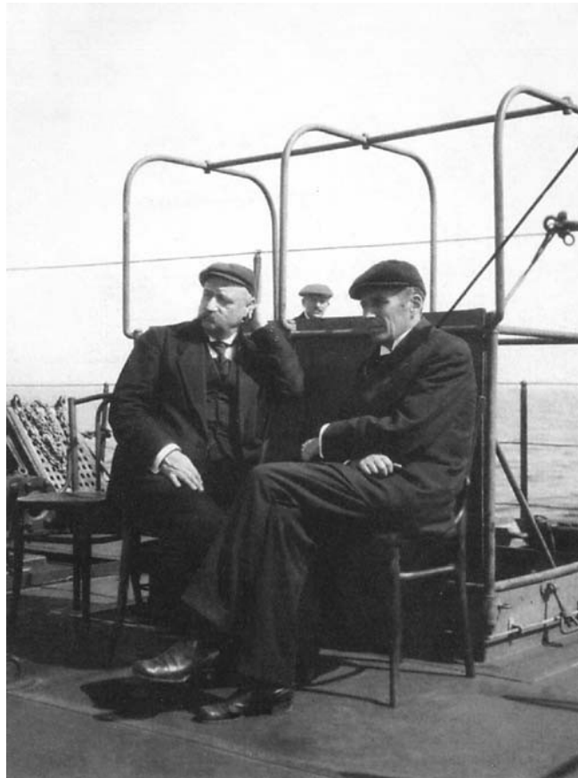
Infantry General N.N. Yudenich (left) and Rear Admiral V.K. Pilkin on the deck of a French steamboat on the way from Helsingfors to Reval. July 26, 1919.

against the Bolsheviks is possible. The second objective of the Conference is to assume the role of the embryonic and provisional government for the Northwestern region. 31