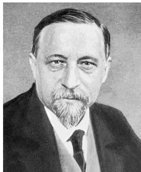
Anton Vladimirovich Kartashev

Anton Vladimirovich Kartashev is known first of all as an outstanding theologian, a historian of the Russian church, the last Chief Procurator of the Most Holy Governing Synod, Minister of Religion in the Provisional Government. During the Civil War he did not stand aside from political activities: he was a member of the Central Committee of the Constitutional Democratic Party, an active participant in a number of underground anti-Soviet organizations, one of the leaders of the White movement in Northwestern Russia. However, this sphere of his activities is not so well known as his work as a scholar, which can be explained by a number of circumstances. On the one hand, during the Civil War Kartashev was “overshadowed” by such political figures as Pyotr Struve and Nikolai Yudenich.