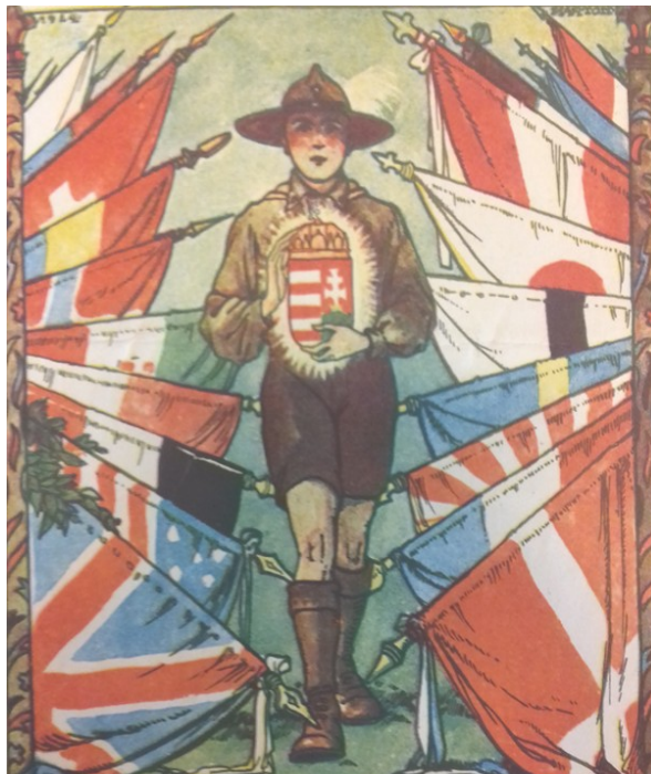
Рис. 2. После успеха в Копенгагене: обложка «Книги Джамбори»

Скаутское движение, стоявшее на тех же идеологических, т. е. религиозно-нравственных и национальных позициях, что и политический режим, пользовалось поддержкой государства. Сотрудничество было взаимовыгодным. Главкомандующим до 1941 г. был регент Миклош Хорти, потом до своей гибели в 1942 г. – его сын и заместитель Иштван Хорти. Главным скаутом в 1921–1923 гг. был один из самых влиятельных политиков своего времени граф Пал Телеки 11 . После отставки Телеки был избран почетным главным скаутом, он также остался членом руководства движения. Для государства оно представляло особый интерес как по внутри-, так и по внешнеполитическим причинам. С его помощью 12 можно было обратиться к широким слоям населения, воспитать подрастающее поколение в духе, как нельзя лучше соответствующем идеям и целям органов народного просвещения. Например, экскурсии и занятия спортом позволяли распространять физическое воспитание, что было особенно ценным после отмены всеобщей воинской повинности. Скаутское движение с разветвленной системой международных связей могло помочь и в преодолении внешнеполитической изоляции, начавшейся после подписания Трианонского