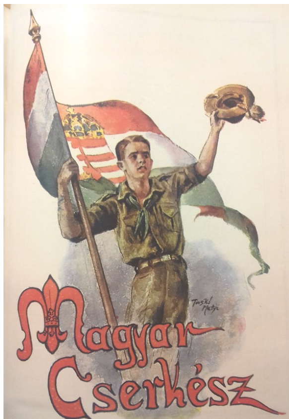
Рис. 1. Титульный лист журнала «Magyar Cserkész»

нию примкнули более юные (6–11-летние «волчата» или «малышня») и более взрослые (те, кому исполнилось 17–18 лет, «старик», «пираты») возрастные группы. Внутри движения выделились направления по интересам: скауты на воде (1921), скауты-менестрели – хранители народной культуры (с 1930-х гг.), скауты-авиаторы (1931). В 1927 г. у движения появилась своя инфраструктура: Дом скаутов, Парк скаутов, Центральный водоем. Знаком признания успехов венгерских скаутов стал приезд Р. Баден-Пауэлла в 1928 г. в Венгрию, где в его честь организовали грандиозный «День скаута».