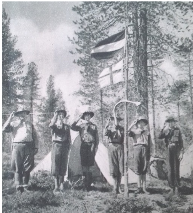
Fig. 5. The expedition of Magyar Cserkész in Finland (1938)

The other two detailed international journeys delineated in a longer account were, however, the undertakings of single Scout troops. Ninety-three members of the Jack-of-All-Trades Scout Troop from the State Machine Factory of Budapest visited Italy. During the three weeks, they toured various cities. In Rome, Pope Pius XI received them, and they were present at the reception for the Hungarian Prime Minister. As a matter of fact, the Scouts were expected to represent their nation at the events that were important for the state. The journey's primary purpose was educational and not suitable for cultivating scout connections, since Scouting was no longer operational in Italy at that time. So the scouts were entitled to discounts available to the Balilla; they also visited the Balilla House in Padua, but because the boys were on a distant drill, the meeting was cancelled. The significance of Hungarian connections for the Italian state is demonstrated by the fact that their troop was received by the Fascist party in Bologna and the leaders of the Dopolavoro. 46 Italy was, in fact, one of the most popular international tourist targets in Scouting circles: in the summer of 1938,