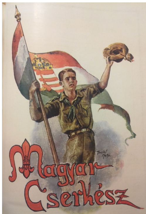
Fig. 1. The Hungarian Scout

The aim of Hungarian Scouting, based on one of its leading personages, the Pia-rist teacher-priest, Sándor Sík, was phrased as follows: “More humane humans, more Hungarian Hungarians!” 9 The membership of scouts increased progressively, with the younger ages (6–11-years-old “pages”, wolf cubs or junior scouts) and older ages (older than 17–18 years: senior scouts, rovers) both joining the movement. Special branches of Scouting also appeared, like Sea Scouting (1921), “Regöscserkészzet” (Folkloric Scouting): gathering folk culture (from the 1930s), and Air Scouting (1931). In 1927, the Association’s infrastructure was established as well: the Scouting House, Scouting Park, and the Central Water Facility. Also, thanks to this development, Robert Baden-Powell visited Hungary in 1928, when a grandiose Scouting Jamboree was organised in his honour.