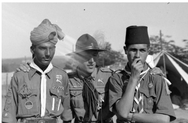
Рис. 3. Скауты на джамбори в Гёделлэ (1933)

...То, что происходит – это великое событие. По прошествии 15 лет юноши протягивают руку дружбы тем, кто пятнадцать лет назад был врагом их отцов 22 .