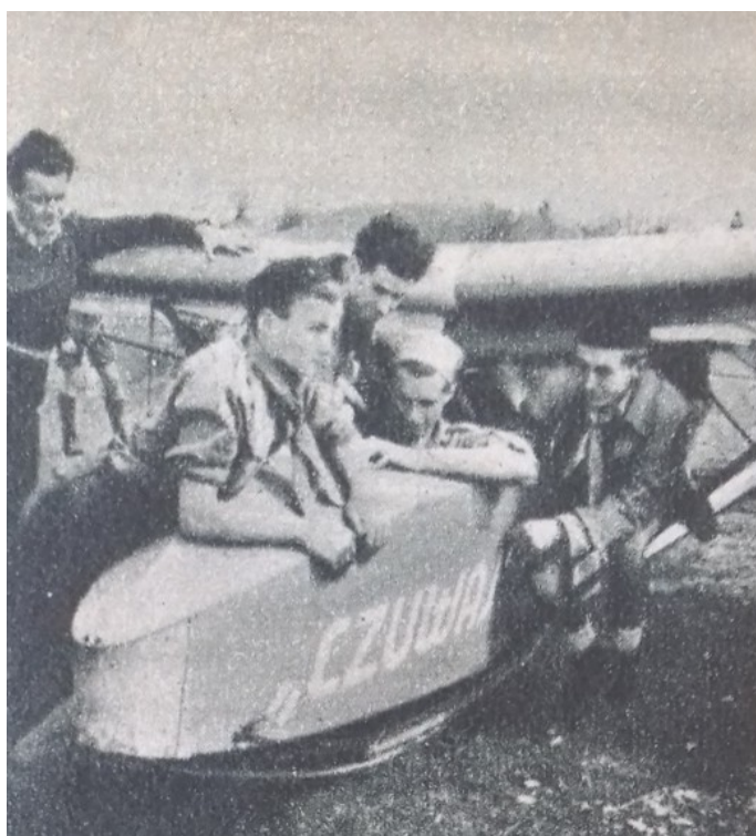
Fig. 6. Hungarians and “Csuvaj”, a gift from the Polish scouts

of the circle justified the necessity of this pact with the traditionally good relationship between the two people, dating back centuries and their similar present situation as well as the exemplary high level of Polish Scouting skills. The cultural agreement between the two states established the legal basis of this pact. Its essential element was camping exchange: Hungarian troops receiving Polish scouts and vice versa. The participation fees were fixed at a very discounted rate. In the summer of 1938, a group of Polish Scouting officers completed a study tour in Hungary. Air scouts developed a similarly intensive connection, forming a cooperation manifested not only in shared camping but also in training. In order to coordinate different activities, Polish-Hungarian Scouting Circle ( Lengyel-Magyar Cserkészkör ) was established to organize celebrations and language courses and to forward the addresses of those who wished to enter into correspondence. In Warsaw, a Central Polish-Hungarian Scout Committee ( Központi Lengyel-Magyar Cserkészbizottság ) was established with a similar aim. On the occasion of the emergence of the shared border, in May 1939, the scouts of the two countries lit a campfire. The Circle's job after September 1939 mainly consisted in aiding the Polish refugees. 59