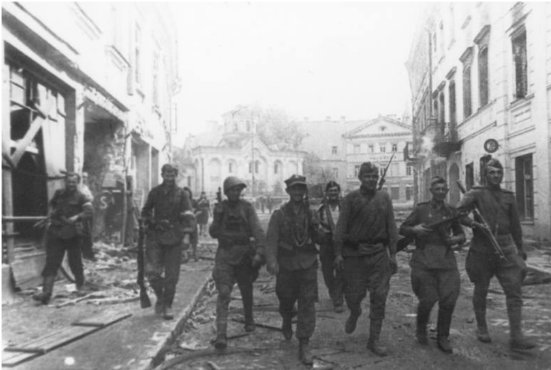
Battle for Vilnius. A patrol of the Home Army and the Red Army during the Operation Ostra Brama, July 1944 r.