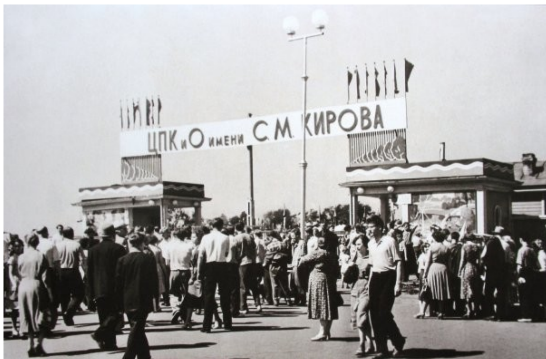
Ленинград. Центральный парк культуры и отдыха им. С.М. Кирова (ЦПКиО). Вход в ЦПКиО. 1950-е гг.

Но поскольку сфера досуга в целом, а также учреждения культуры и парки как их структурные подразделения находились под неусыпным контролем партийных органов, их деятельность была направлена в первую очередь на воспитание советских граждан – строителей коммунизма. Этим объясняется выбор и формы, и содержания всей деятельности в сфере досуга.