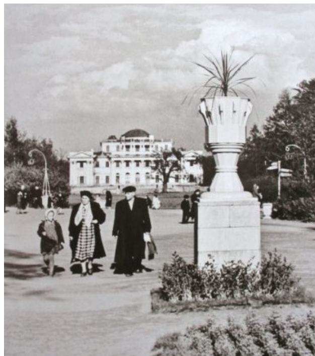
Ленинград. Центральный парк культуры и отдыха им. С.М. Кирова (ЦПКиО). Аллеи парка. 1955 г.