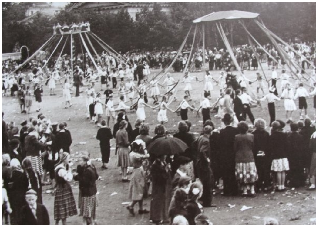
Leningrad. S. Kirov Central Park of Culture and Leisure (Kirov Park). City-wide holiday dedicated to the City day. Leningrad. 1957

Sometimes, the assessments of the events held and of the general atmosphere of the park were opposite, but positive views still dominated. Some visitors spoke with