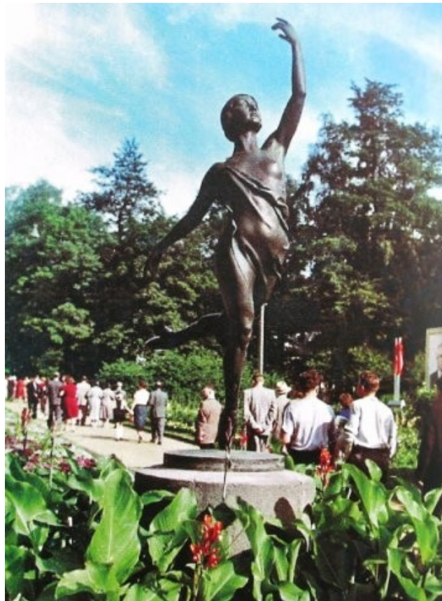
Leningrad. S. Kirov Central Park of Culture and Leisure (Kirov Park). Central alley of the park. Sculpture ‘Ballerina Ulanova.’ 1960s