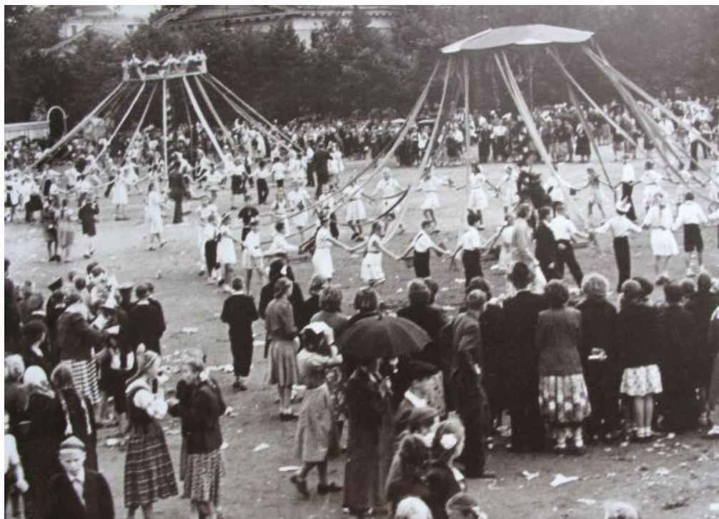
Ленинград. Центральный парк культуры и отдыха им. С.М. Кирова (ЦПКиО). Общегородской праздник, посвященный Дню города. Ленинград. 1957 г.