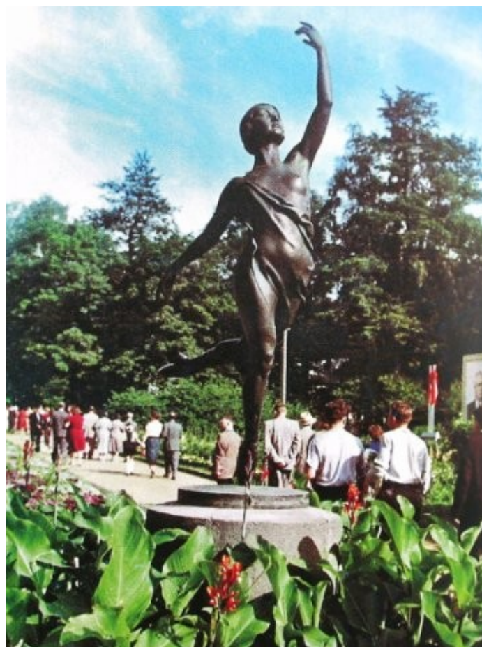
Ленинград. Центральный парк культуры и отдыха им. С.М. Кирова (ЦПКиО). Центральная аллея парка. Скульптура «Балерина Уланова». 1960-е

тии, Ленгорисполкома, Комитета по культуре, планы и отчеты учреждения, а также сценарии праздников и стенограммы конференций посетителей парка. Именно в них содержится репрезентативный материал, состоящий из неформальной и искренней реакции населения, включающей в том числе и мнения о проводимых мероприятиях, рекомендации, пожелания и иногда критику в адрес ЦПКиО.