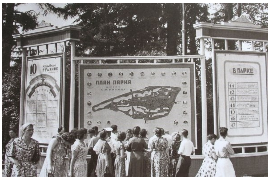
Ленинград. Центральный парк культуры и отдыха им. С.М. Кирова (ЦПКиО). Посетители перед планом-схемой парка. 1956 г.

В Ленинграде с 1932 г. новой формой организации досуга и культурно-массовой работы стало посещение Центрального парка культуры и отдыха (ЦПКиО). Он был расположен на Елагином острове и со временем превратился в самое посещаемое место отдыха горожан. После гибели С.М. Кирова в 1934 г. ЦПКиО было присвоено его имя.