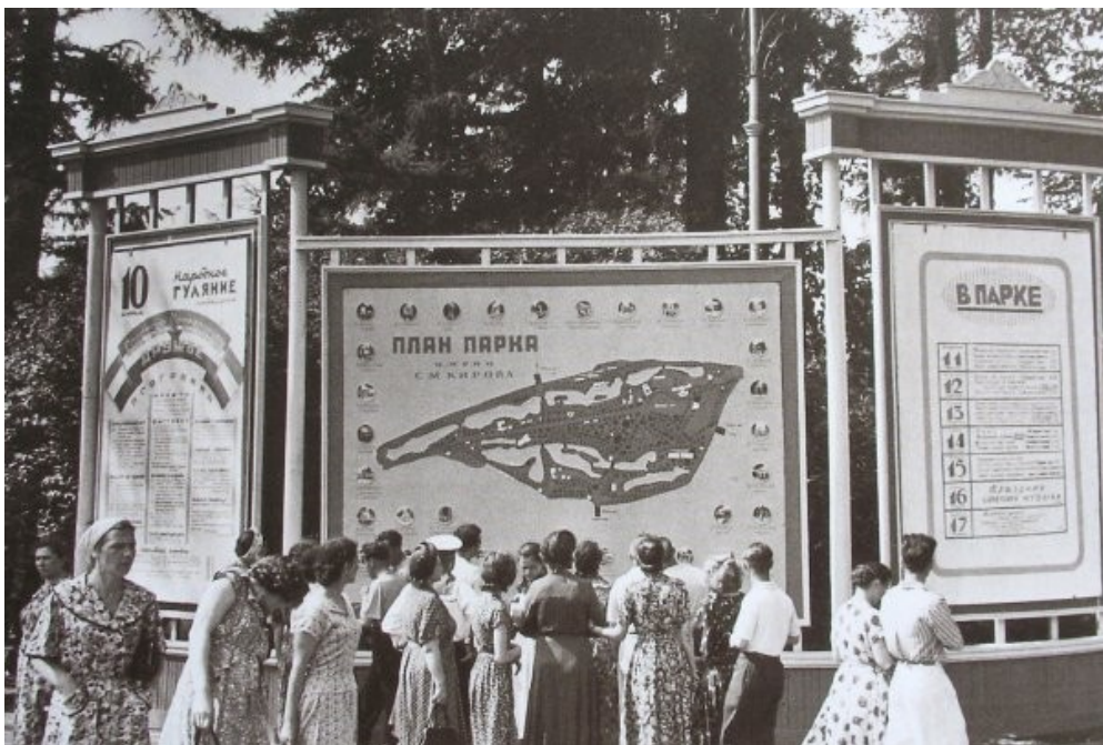
Leningrad. S. Kirov Central Park of Culture and Leisure (Kirov Park). Visitors in front of the diagrammatic plan of the park. 1956.

Since 1932, visiting Central Park of Culture and Leisure (Kirov Park) had become a new form of organizing leisure and cultural work in Leningrad. The park was located on Yelagin Island and eventually turned into the most visited place of recreation of the citizens. After the death of S. Kirov in 1934, the park was named after him.