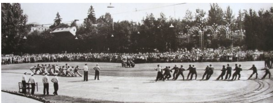
Ленинград. Центральный парк культуры и отдыха им. С.М. Кирова (ЦПКиО). Большая площадь. День Военно-Морского флота. 1963 г.

Администрацию парка вряд ли волновало, насколько подобные планы отвечали индивидуальным интересам школьников, являлись познавательным, способствовали развитию интеллектуальных и творческих способностей подрастающего поколения. Однако, несмотря на то, что идеологическая составляющая была основой практически всех мероприятий, проводимых в парке, фактически она органично вписывалась в его работу и не отталкивала посетителей. Предположим, что это происходило из-за отсутствия альтернативных мест и способов проведения досуга.