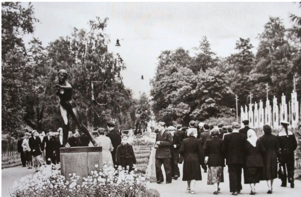
Ленинград. Центральный парк культуры и отдыха им. С.М. Кирова (ЦПКиО). Центральная аллея парка. 1950-е

человека, определились и формы работы с населением, и в частности в культурно-массовой сфере. Нередко формам культурно-массовой работы были присущи свои паттерны и штампы, единообразие, заорганизованность, отсутствие творческого начала, индивидуального подхода и самодеятельности.