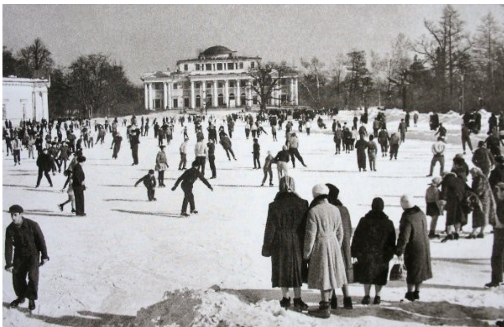
Leningrad. S. Kirov Central Park of Culture and Leisure (Kirov Park). Skating rink in Maslyany Meadow. 1963.

The reports of Kirov Park were full of figures on the number of festivals, exhibitions and participation of children and adults in the activities. Visitors to the park really improved their health and gained new knowledge, impressions, and emotions there.