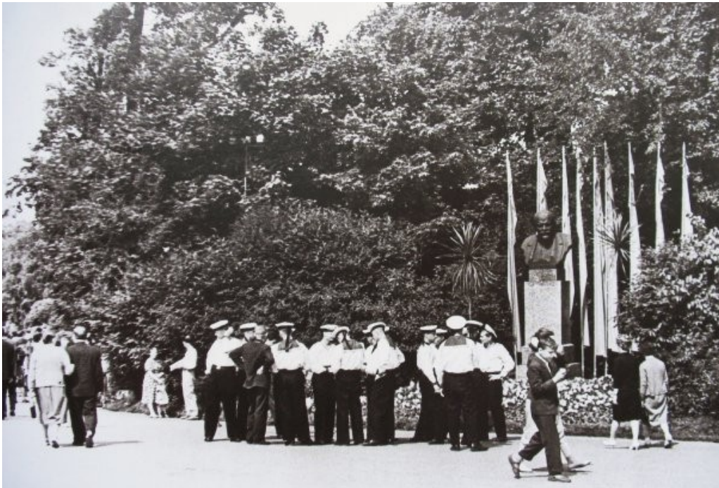
Leningrad. S. Kirov Central Park of Culture and Leisure (Kirov Park). Alleys of the park. 1963

The purpose of such celebrations was universal: not only did they fill free time, but they also facilitated expanding knowledge about the city, district and street; they also contributed to career guidance and in general were supposed to make participants happier due to the opportunity of collective interaction.