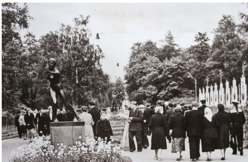
Leningrad. S. Kirov Central Park of Culture and Leisure (Kirov Park). The central alley of the park. 1950s

In different periods of social development, each generation and each age category of people were characterized by their own forms of organizing everyday life and spending leisure time, as well as their own formula of happiness. In the Soviet period, the forms of work with the population, in the cultural sphere in particular, were determined in accordance with the prevailing ideology and the tasks set by the Communist Party and the government in the sphere of educating the Soviet person. The forms of cultural work often had their own patterns and clichés, uniformity, and over-organization as well as lack of creativity, individual approach and initiative.