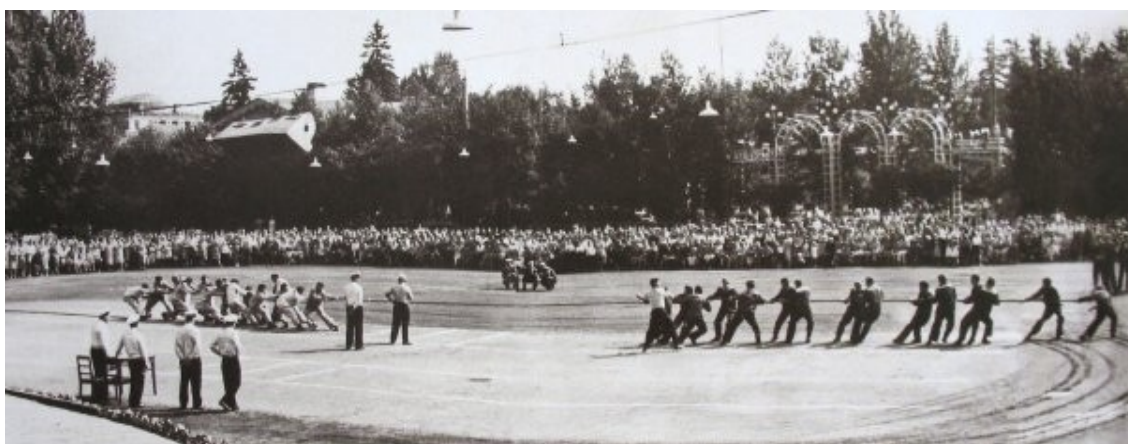
Leningrad. S. Kirov Central Park of Culture and Leisure (Kirov Park). Big Square. Navy Day. 1963.

The park administration was unlikely to be concerned about whether such plans met the individual interests of schoolchildren, were informative, and contributed to the development of intellectual and creative abilities of the younger generation. However, despite the fact that the ideological component was the basis of almost all events held in the park, in fact, it fit seamlessly into its work and did not repel visitors. We assume that this was due to the lack of alternative places and ways to spend leisure time.