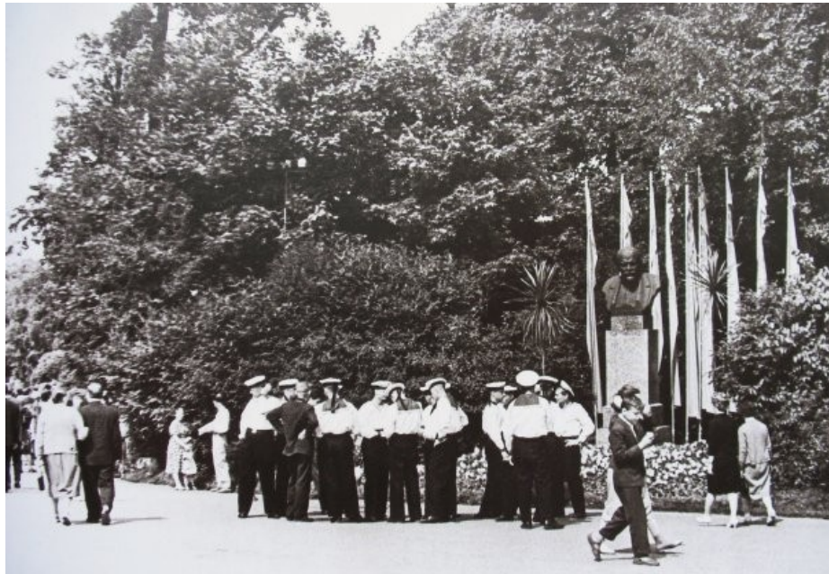
Ленинград. Центральный парк культуры и отдыха им. С.М. Кирова (ЦПКиО). Аллеи парка. 1963 г.

Цель у таких праздников была универсальной: они не только заполняли свободное время, но и позволяли расширять знания о городе, районе, улице, а также способствовали профорientации и, в целом, должны были сделать участников счастливее от возможности коллективного взаимодействия.