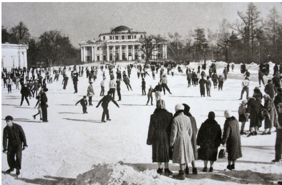
Ленинград. Центральный парк культуры и отдыха им. С.М. Кирова (ЦПКиО). Каток на Масляном лугу. 1963 г.

Предметом гордости для парка была его профориентационная деятельность. Детский сектор парка совместно с Ленинградским управлением трудовых резервов создали