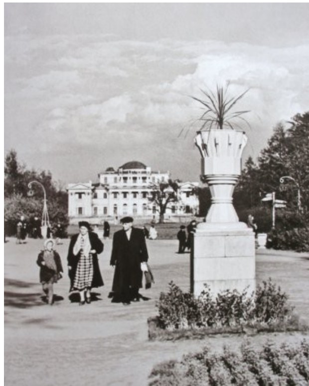
Leningrad. S. Kirov Central Park of Culture and Leisure (Kirov Park). Alleys of the park. 1955

Citizens also loved and appreciated Kirov Park for its spiritual atmosphere and for the opportunity to find something to do in accordance with their interests, hobbies and age. The TsGALI fonds of Kirov Park contains transcripts of conferences and meetings of the administration and members of the public and visitors, which recorded the opinions of citizens and their assessments of the park's work, events, and general atmosphere. The views and suggestions of citizens were sometimes polar opposites, but it is what makes it possible to create a comprehensive and objective picture of the population's attitude to the work of Kirov Park and also to consider priorities in organizing leisure activities during the period under study.