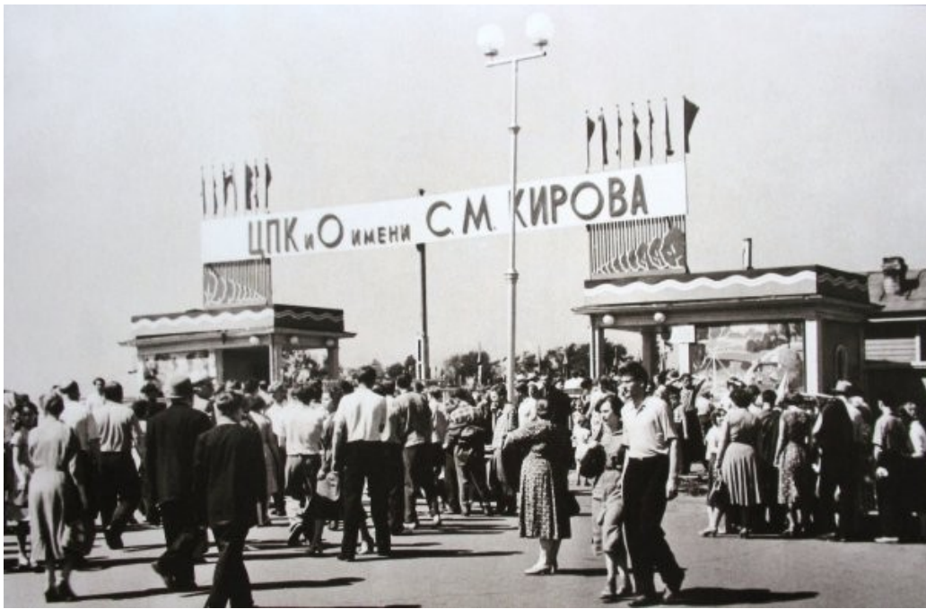
Leningrad. S. Kirov Central Park of Culture and Leisure (Kirov Park). Entrance to the park. 1950s

Since 1932, visiting Central Park of Culture and Leisure (Kirov Park) had become a new form of organizing leisure and cultural work in Leningrad. The park was located on Yelagin Island and eventually turned into the most visited place of recreation of the citizens. After the death of S. Kirov in 1934, the park was named after him.