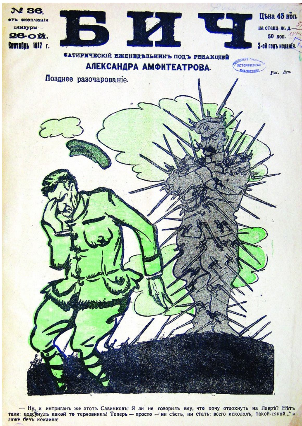
Карикатура «Позднее разочарование» // Бич. – 1917. – Сентябрь.

Это вызывало противодействие Советов, войсковых комитетов, профсоюзов и лидеров умеренных социалистов, они обличали Корнилова, а порой и критиковали Керенского за недостаточное противодействие «контрреволюции».