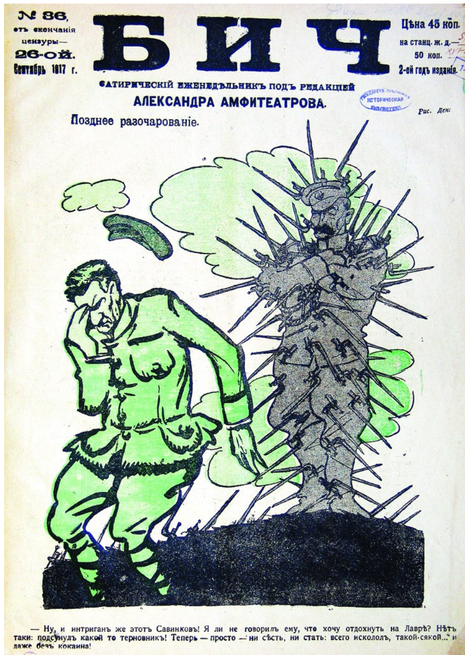
Caricature. "Belated disappointment." Bich , September 1917.

Various forces tried to secure a political union between Kornilov and Kerensky in order to limit the influence of the Soviets and committees. The head of the Provisional Government and the Commander-in-Chief made a secret agreement according to which reliable troops were to be transferred to Petrograd. That agreement could not be long-lasting: the parties reasonably suspected each other of their own political games. Kerensky was thinking about the dismissal of Kornilov, and the entourage of the Commander-in-Chief hated Kerensky and made plans to form the government with Kornilov at the head. Mutual intrigues of Kerensky and Kornilov, in which their associates were also involved, resulted in an open confrontation. Kerensky demanded that Kornilov resign, the general refused to do so and openly opposed the Provisional