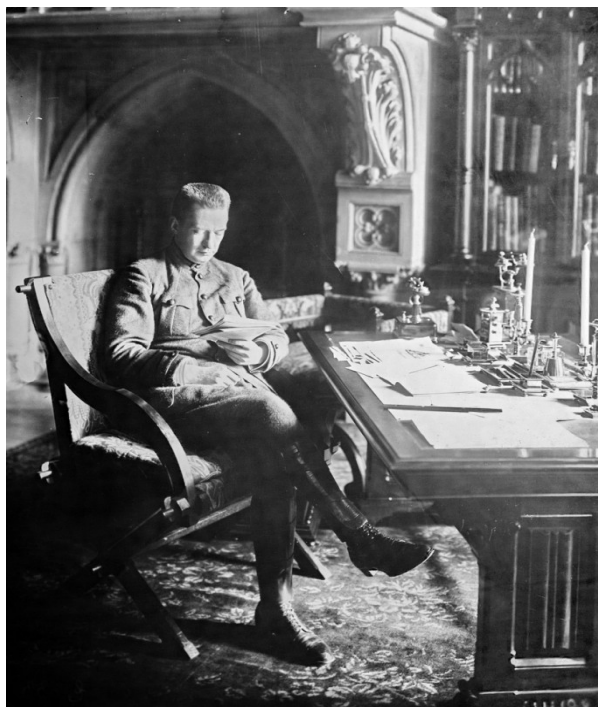
Фото А.Ф. Керенского в кресле

После падения монархии популярность А.Ф. Керенского, министра юстиции, «министра народной правды» оформлялась с помощью образов «борца за свободу», «министра-демократа», «народного министра», «первого гражданина».