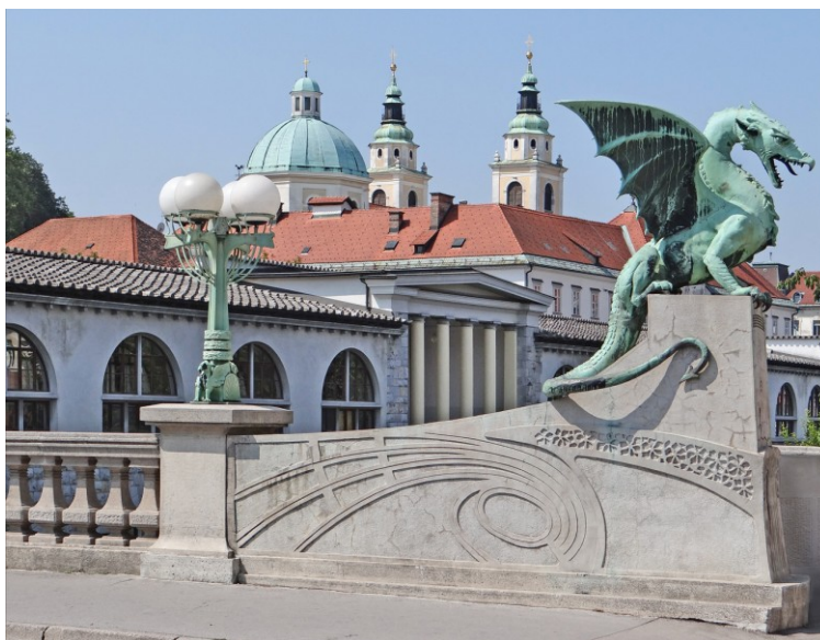
Змайски мост (мост Драконов). 1900–1901

город, а также послужили благой цели словенских патриотов той поры – пробудить национальное самосознание своего народа 53 .