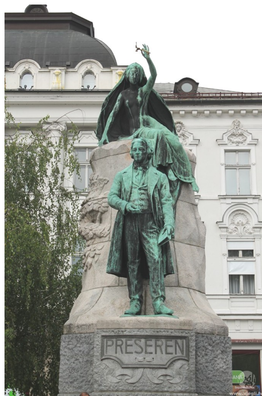
Monument to France Prešeren, a Slovenian poet. 1905