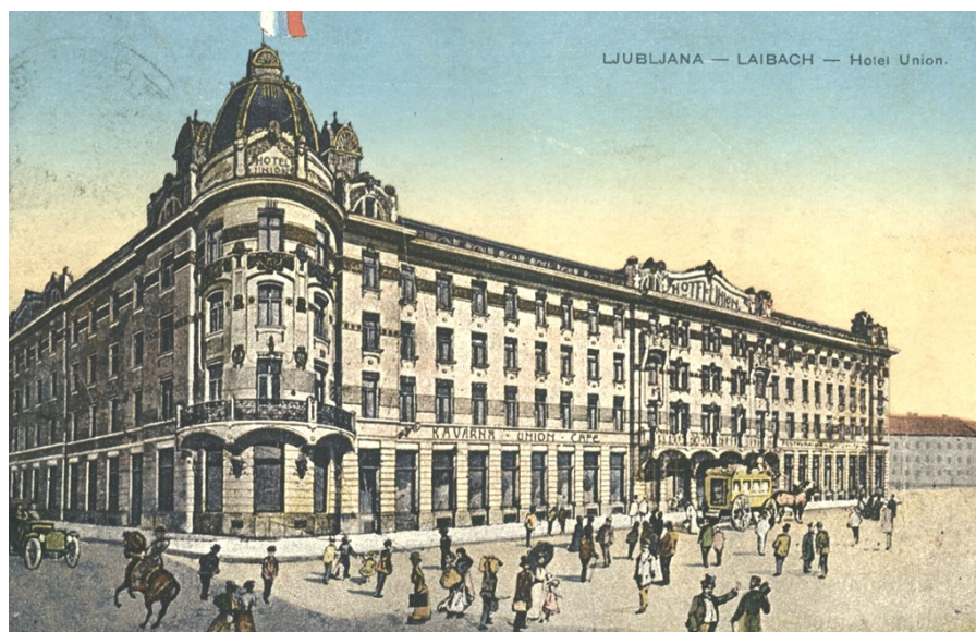
The Union Hotel. 1903–1905

On arrival in Ljubljana nine years after the earthquake, Josip Vošnjak, a well-known Slovenian liberal, highly appreciated the changes in the city and the activities of the župan: