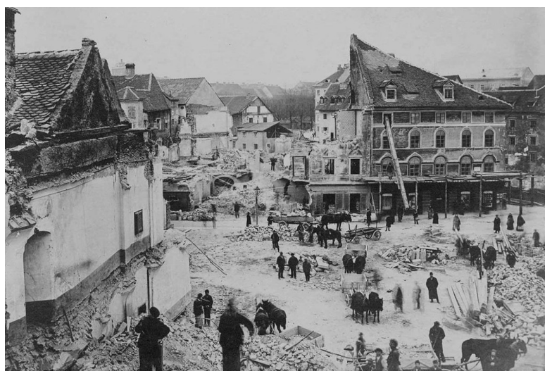
Любляна после землетрясения. 1895 г.