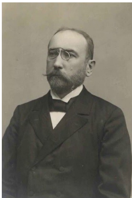
Иван Хрибар (1851–1941)

Улицы Любляны в то время были узкими, кривыми и грязными, в темное время суток освещения на них почти не было. В городе стояла вонь от мусорных куч и выгребных ям, к тому же, многие жители, как и в прежние времена, выливали на улицу ночные горшки. Водопровода и электричества не было. Питьевую воду набирали в основном из городских колодцев (их было 12) или из родников в окрестностях. Для других нужд брали воду из протекающей по городу реки Любляницы. Качество воды из колодцев было довольно плохим, а с ростом населения города ее вообще стало не хватать. Уровень гигиены был крайне низок и не соответствовал элементарным санитарным нормам. И без того плохие условия жизни еще больше ухудшались из-за постоянного роста числа жителей.