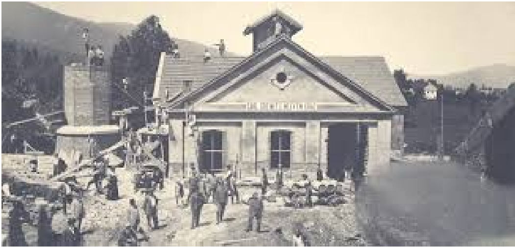
Construction of the first power station in Ljubljana

The earthquake gave impetus to the city-planning transformations carried out according to the designs of the Viennese architect Max Fabiani. The territory of Ljubljana expanded. During Hribar's mayoralty (until 1910), about 500 new buildings were constructed and their total number nearly doubled if compared to that before the earthquake. 31 New straight wide streets and avenues were laid out. In accordance with the new European standards, the župan attached great importance to the arrangement of green spaces, so the new lanes and parks, "the lungs of the city" 32 were laid out and the old ones were expanded.