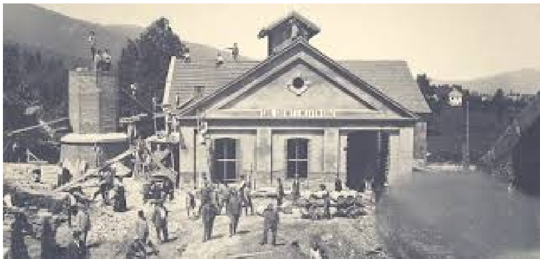
Строительство первой электростанции в Любляне