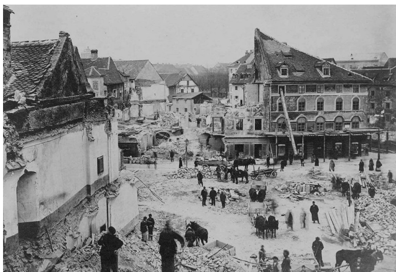
Ljubljana after the earthquake. 1895