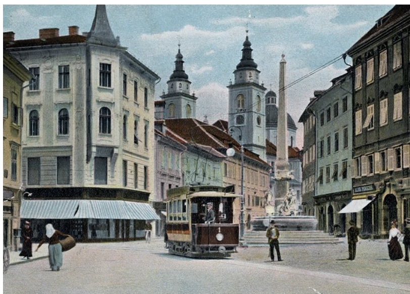
Трамвай в Любляне

Землетрясение дало толчок градостроительным преобразованиям, проведенным по проектам венского архитектора Макса Фабиани. Территория Любляны расширилась. За время жупанства Хрибара (до 1910 г.) в городе было построено около 500 новых зданий, их количество по сравнению с тем, что было